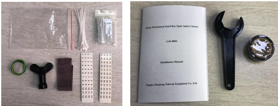
附件图片为检验参考, 不作为附件数量或者规格的检验依据