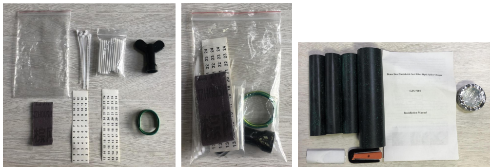
附件图片为检验参考，不作为附件数量或者规格的检验依据