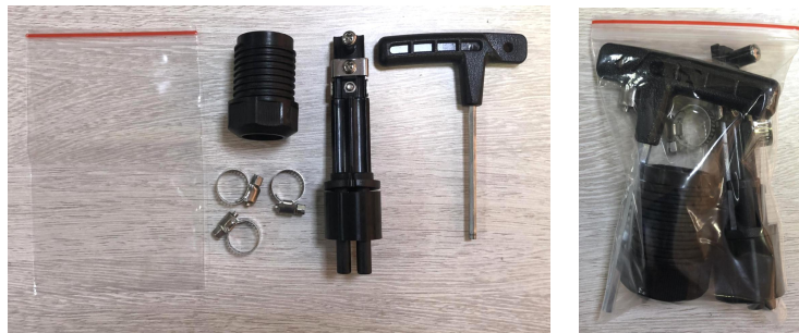
附件图片为检验参考，不作为附件数量或者规格的检验依据