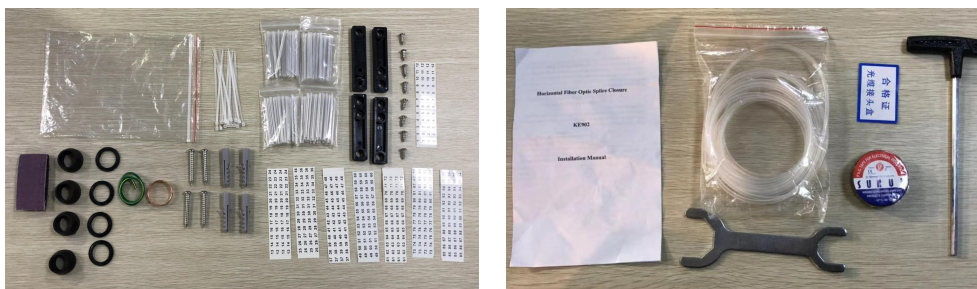
附件图片为检验参考，不作为附件数量或者规格的检验依据